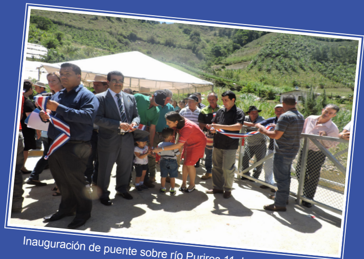
Inauguración de puente sobre río Purires 11 de mayo de 2016