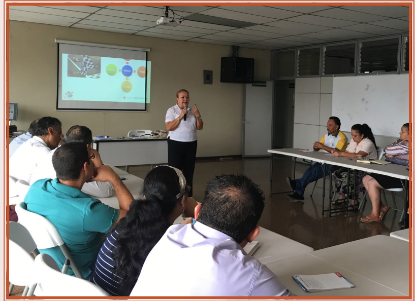
En el taller se aprende a realizar un presupuesto familiar

El objetivo de estas actividades es que las personas participantes aprendan conceptos financieros básicos como el ahorro, finanzas personales, elaboración de presupuestos, administración de gastos y uso de tarjetas, entre otros temas que requieren para una buena economía familiar y organizacional.