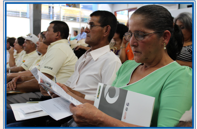
Dirigencia comunal presente en la inauguración de VII Congreso Nacional de ADC

En la etapa de participación abierta se realizó una consulta con representantes de las trece federaciones existentes, así como de otros sectores de la ciudadanía, la cual dio inicio el 2 de abril y finalizó el 24 de mayo, con una respuesta significativamente positiva de 1255 personas que participaron bajo una sola consigna: mejorar el desarrollo de sus comunidades y, por ende, la calidad de vida del país, objetivo final del Plan Nacional de Desarrollo de la Comunidad (PNDC), que será el producto del Congreso.