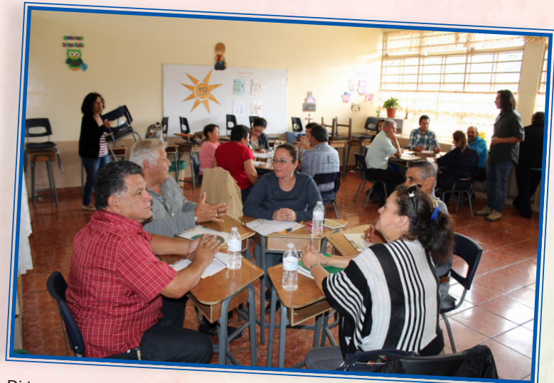
Dirigencia comunal cartaginesa en las mesas de trabajo en la escuela Nuestra Señora de los Ángeles 7 de mayo.

Con este Plan se espera articular toda la problemática existente de las comunidades, permitiendo una interacción eficiente con Dinadeco, para mejorar y facilitar el desarrollo social, cultural, ambiental, económico y de infraestructura del país, brindando mecanismos asertivos a los desafíos propuestos por el Estado de la Nación.