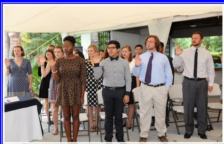
Aspirantes CED-tomando juramento

El Cuerpo de Paz es una agencia federal independiente de los Estados Unidos, establecida el 1 de marzo de 1961 por el presidente John F. Kennedy con el propósito de promover la paz y la amistad mediante el servicio voluntario de profesionales dispuestos a servir en el extranjero, bajo condiciones difíciles si es necesario, y ayudar a las personas de tales países a satisfacer sus necesidades de mano de obra calificada. Desde entonces, más de 210.000 personas han trabajado como voluntarios del Cuerpo de Paz en más de 70 países, colaborando con los gobiernos, instituciones educativas, organizaciones no lucrativas y organizaciones no gubernamentales, en temas como negocios, tecnología de información, agricultura y ambiente.