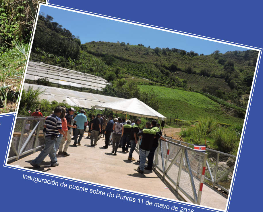
Inauguración de puente sobre río Purires 11 de mayo de 2016