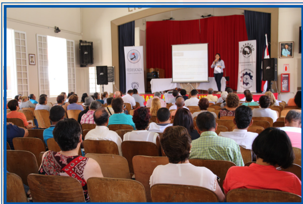
Foro regional Central Occidental 9 de abril.