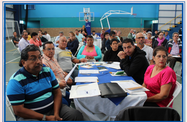
Foro regional Central Oriental 5 de mayo.