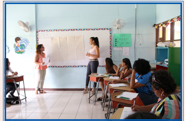
Foro regional Huetar Caribe 16 de abril.