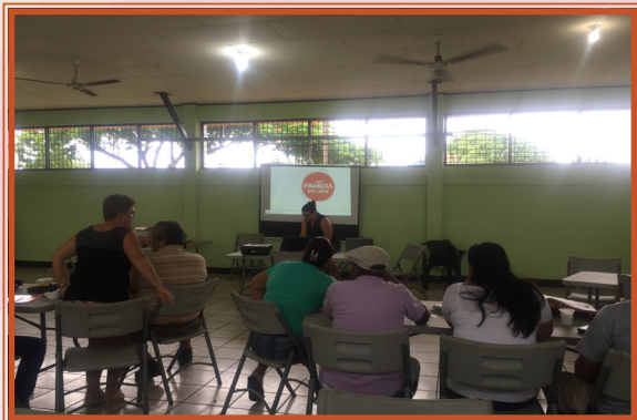
Taller de educación financiera para dirigentes comunales de Limón.