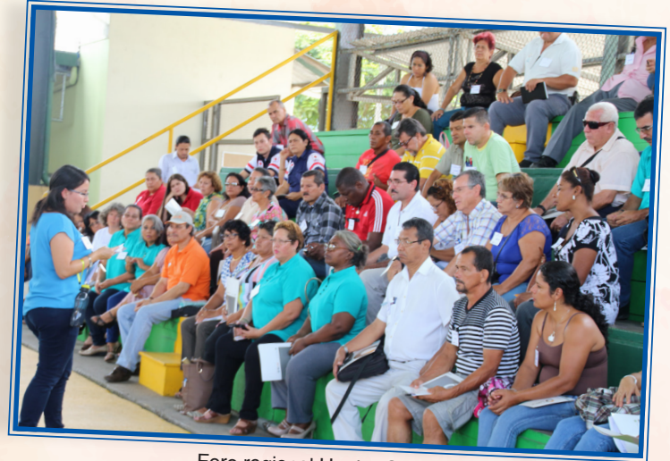
Foro regional Huetar Caribe 16 de abril

El punto culminante del Congreso Nacional tendrá lugar en el mes de agosto cuando se consoliden los hallazgos de los foros regionales para dar lugar al Plan Nacional de Desarrollo de la Comunidad que será el hilo conductor del movimiento comunal costarricense durante los próximos años.