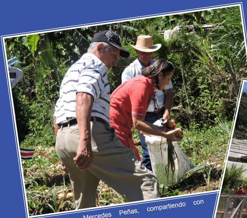
Primera dama Mercedes Peñas, compartiendo con agricultores de Tablón

En el pasado, la comunidad de Tablón se habían visto beneficiada con recursos aportados por Dinadeco para diversos proyectos, siendo uno de ellos la construcción del salón comunal, en el año 2002, una obra de 400 metros cuadrados que ha sido de gran beneficio para la población local. Este proyecto también tuvo aportes de la Municipalidad, el fideicomiso Claude Hope y los vecinos.