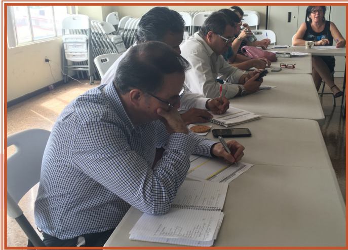
Personal de Dinadeco durante el taller

Estos talleres se están impartiendo para el personal de Dinadeco, sin embargo, ya se impartió uno a dirigentes de organizaciones comunales de Limón.