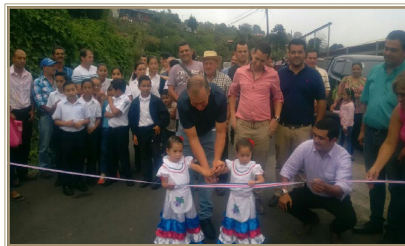
Calle Vargas y Las Virtudes de Santa Cruz