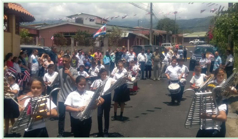
Ciudadela Abel Sáenz