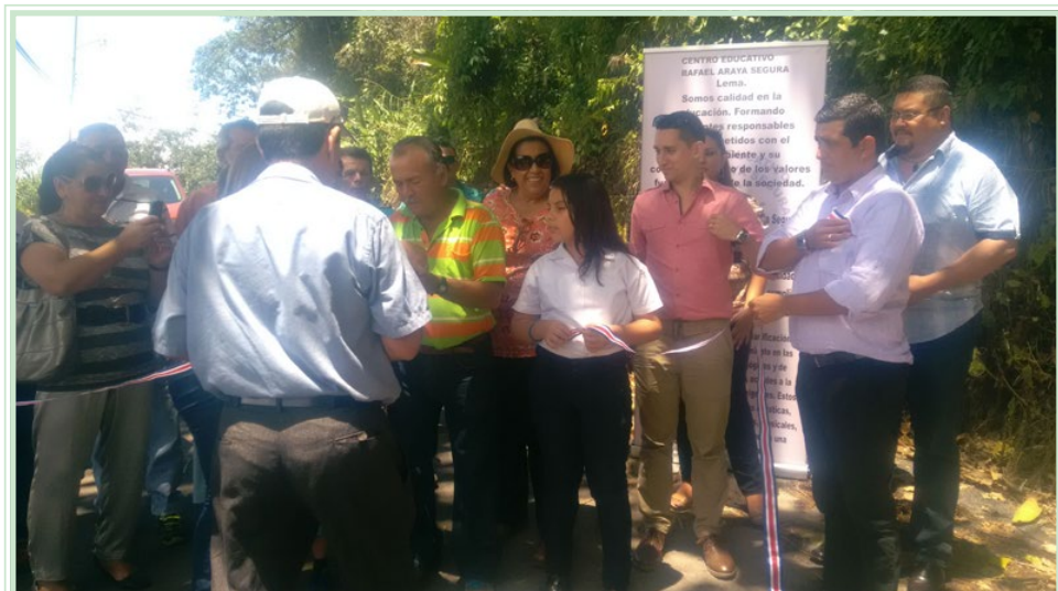
Sitio Mata de Pavones