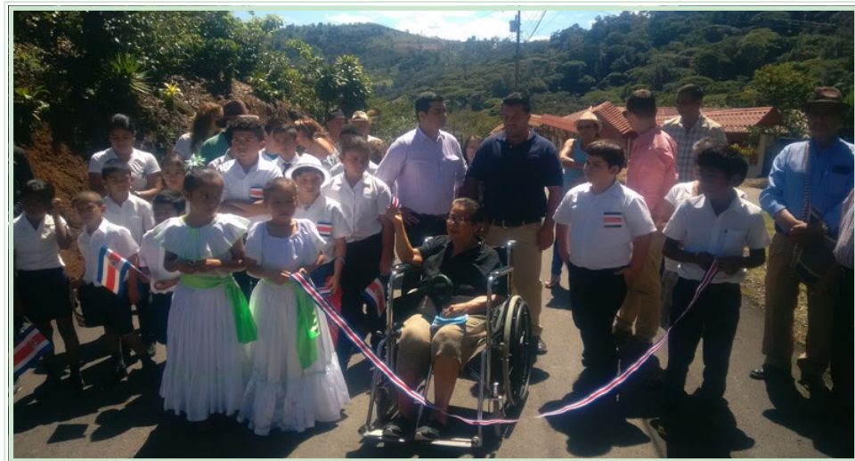
San Joaquín de Tuis