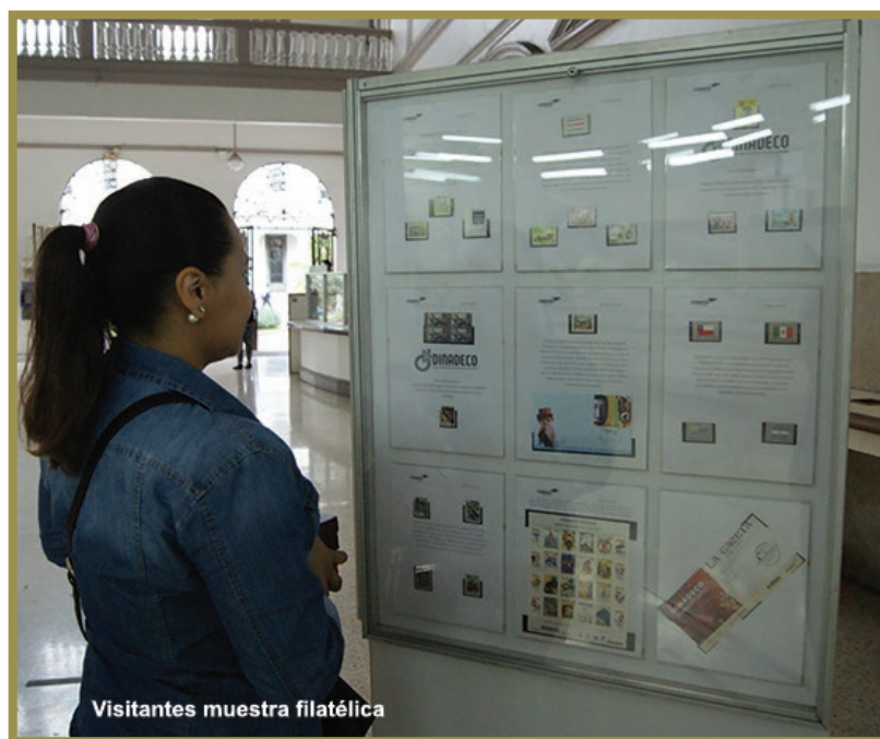
Visitantes muestra filatélica

Los sellos en exposición fueron agrupados con motivos, entre los que destaca el que manifestaba que “unir las fuerzas vivas de una sociedad moderna, tales como la industria, los recursos naturales y el trabajo en equipo, con herramientas complejas y manos expertas, para utilizarlas en un ambiente de valores democráticos, solo se logra con esmero y trabajo entre instituciones como Dinadeco y las personas que integran las organizaciones comunales” .