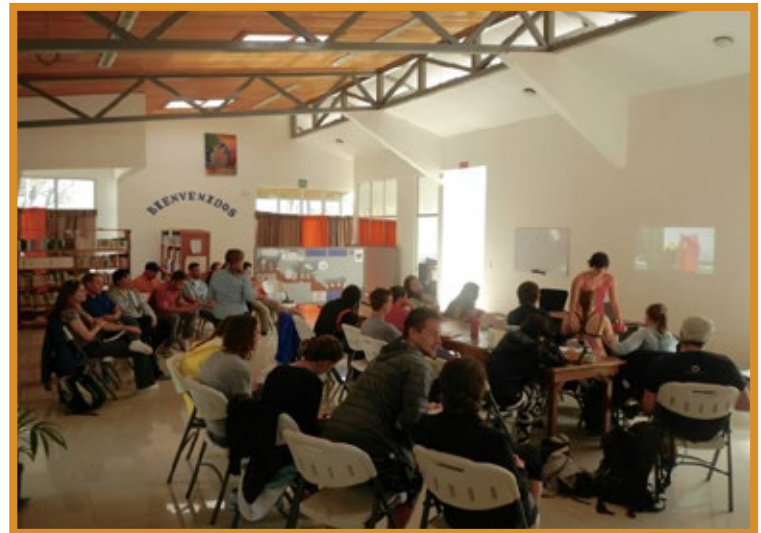
Presentación con visitantes de programa internacional en el Centro Comunitario

Los habitantes de la comunidad de San Luis se esfuerzan por forjar y mantener una adecuada calidad de vida, en armonía con la naturaleza, el desarrollo y la tranquilidad. El pasado, y el presente.