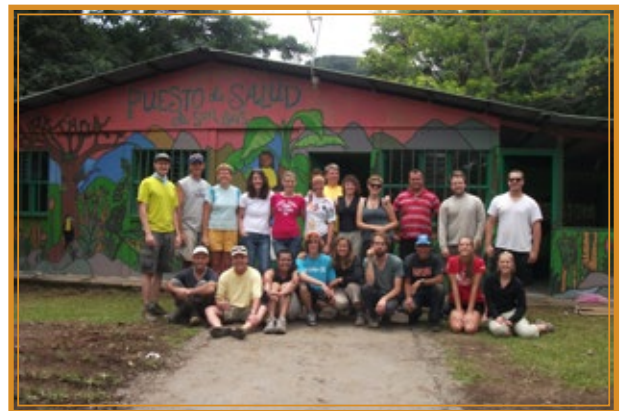
Puesto de salud de la comunidad, el mantenimiento se realiza con mano de obra voluntaria de la comunidad y con voluntarios visitantes.

Asimismo, la organización comunal desarrolla un programa de turismo rural comunitario, un esfuerzo para articular los esfuerzos de un grupo de emprendimientos locales dedicados a esta actividad, incluidos los que incursionan en el mercado con productos específicos, una experiencia con objetivos de desarrollo integral y sostenible, ya que ofrece la oportunidad para aprovechar los recursos de manera equitativa y sostenible.