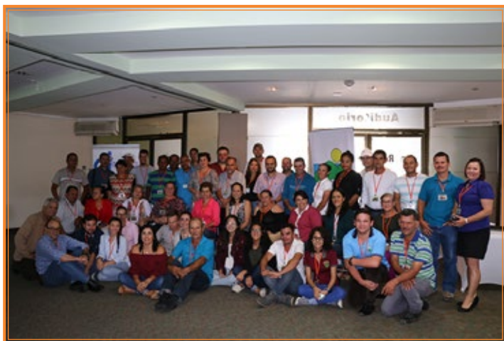
Dirigencia comunal participante del encuentro

Alejandra Abarca / aabarca@dinadeco.go.cr