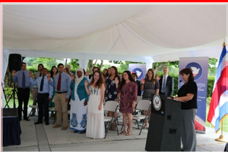
Juramentación de los 24 voluntarios