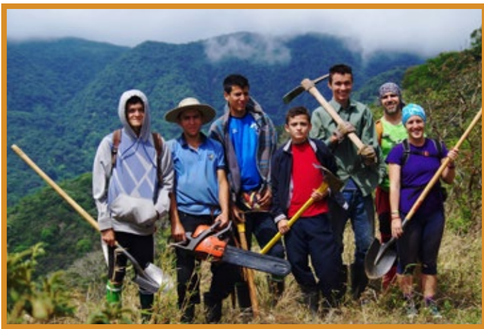
Estudiantes de secundaria de la comunidad que realizan su práctica de especialidad en Turismo Rural. Comparten experiencia con voluntarios extranjeros

Una de las principales atracciones del programa de turismo rural comunitario es el Sendero Pacífico, formado por una red de senderos locales y de otras comunidades, que ofrece la oportunidad para que visitantes de todas las edades puedan entrar en contacto con la biodiversidad del lugar y se extiende a lo largo de varias comunidades rurales, desde Monteverde hasta Guacimal.