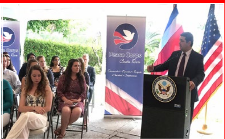
El director nacional de Dinadeco agradece a los voluntarios el aporte que ofrecerán a las asociaciones de desarrollo.