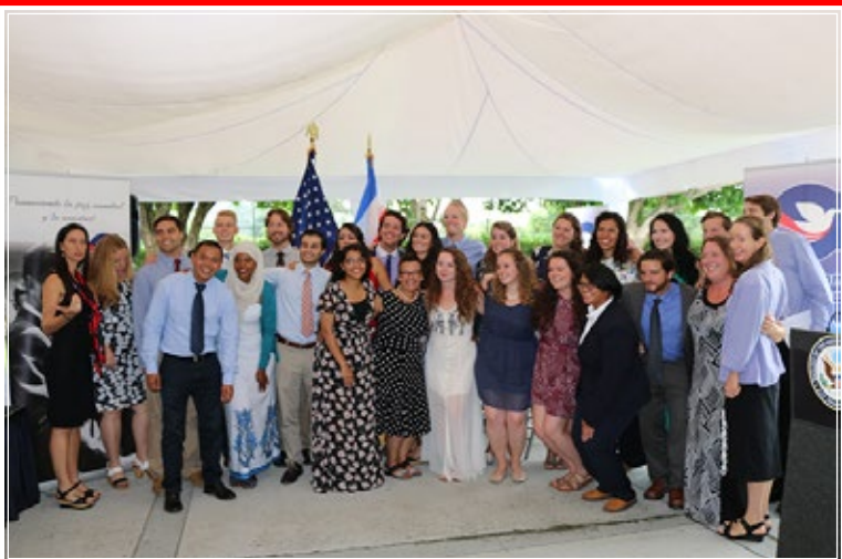
Los 24 nuevos voluntarios se comprometieron a 2 años de servicio en Costa Rica.

El Cuerpo de Paz es un proyecto fundado por el expresidente John F. Kennedy, en 1961, con el fin de compartir profesionales capacitados de Estados Unidos con naciones necesitadas y así construir lazos de amistad y cooperación. La organización envía voluntarios a más de 70 países a trabajar con gobiernos, escuelas, organizaciones no lucrativas, organizaciones no gubernamentales y empresas, en las áreas de educación, negocios, tecnología de información, agricultura y ambiente.